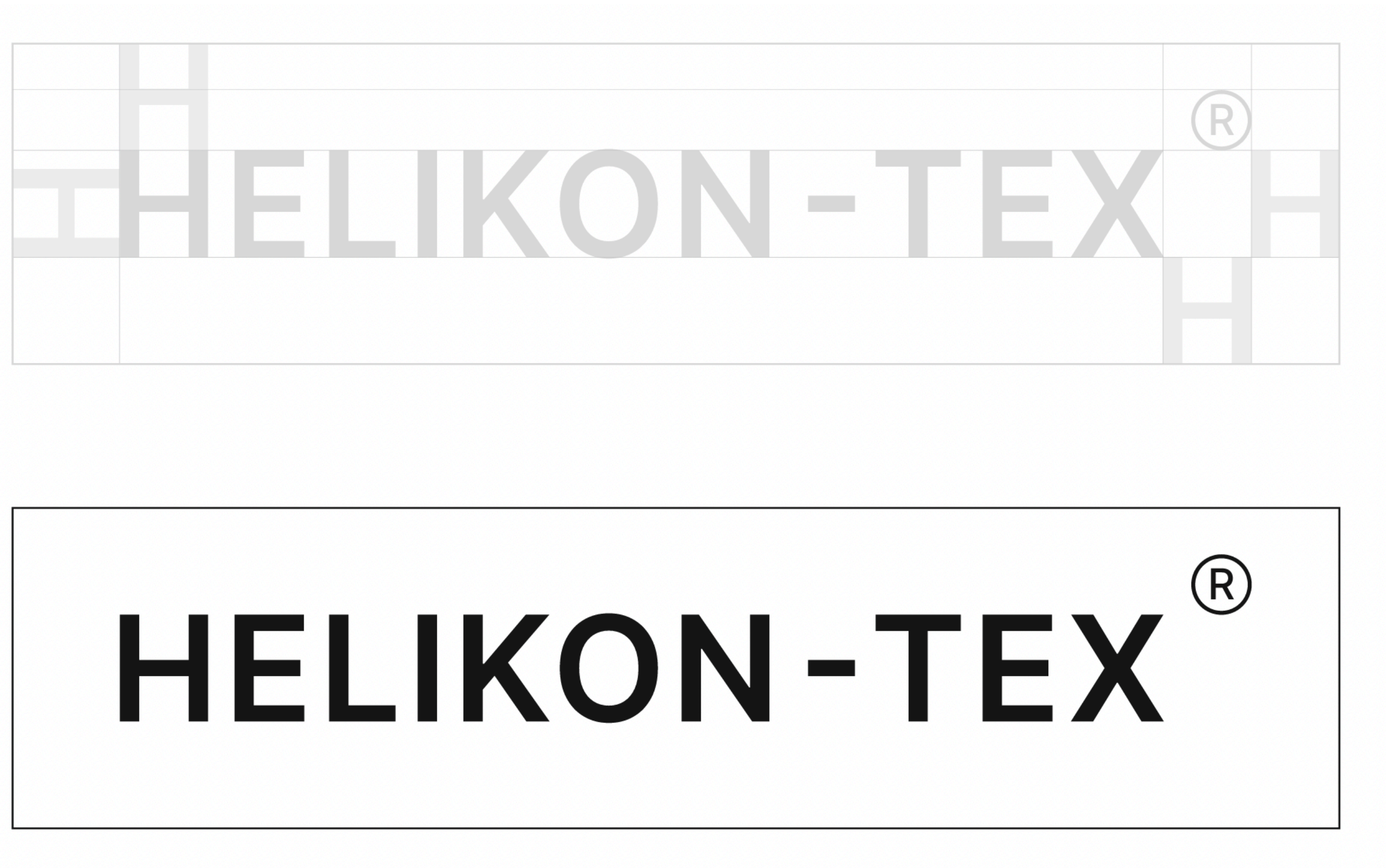
Konstrukcja pola ochronnego logotypu.

W celu właściwej ekspozycji logotypu zostało zastosowane pole ochronne. Pole ochronne to najmniejsza możliwa zamknięta przestrzeń otaczająca znak graficzny.