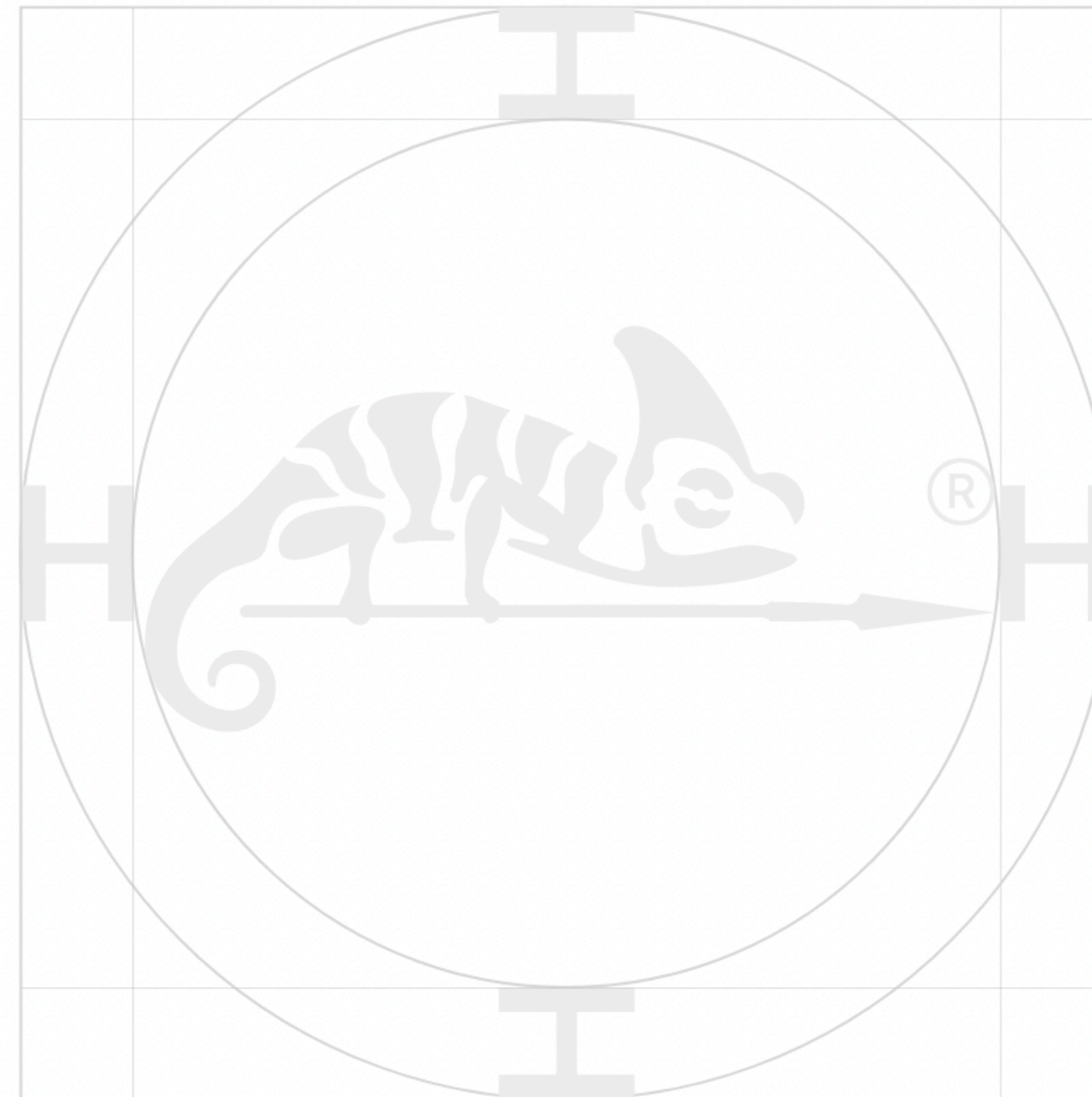
Konstrukcja pola ochronnego sygnetu.