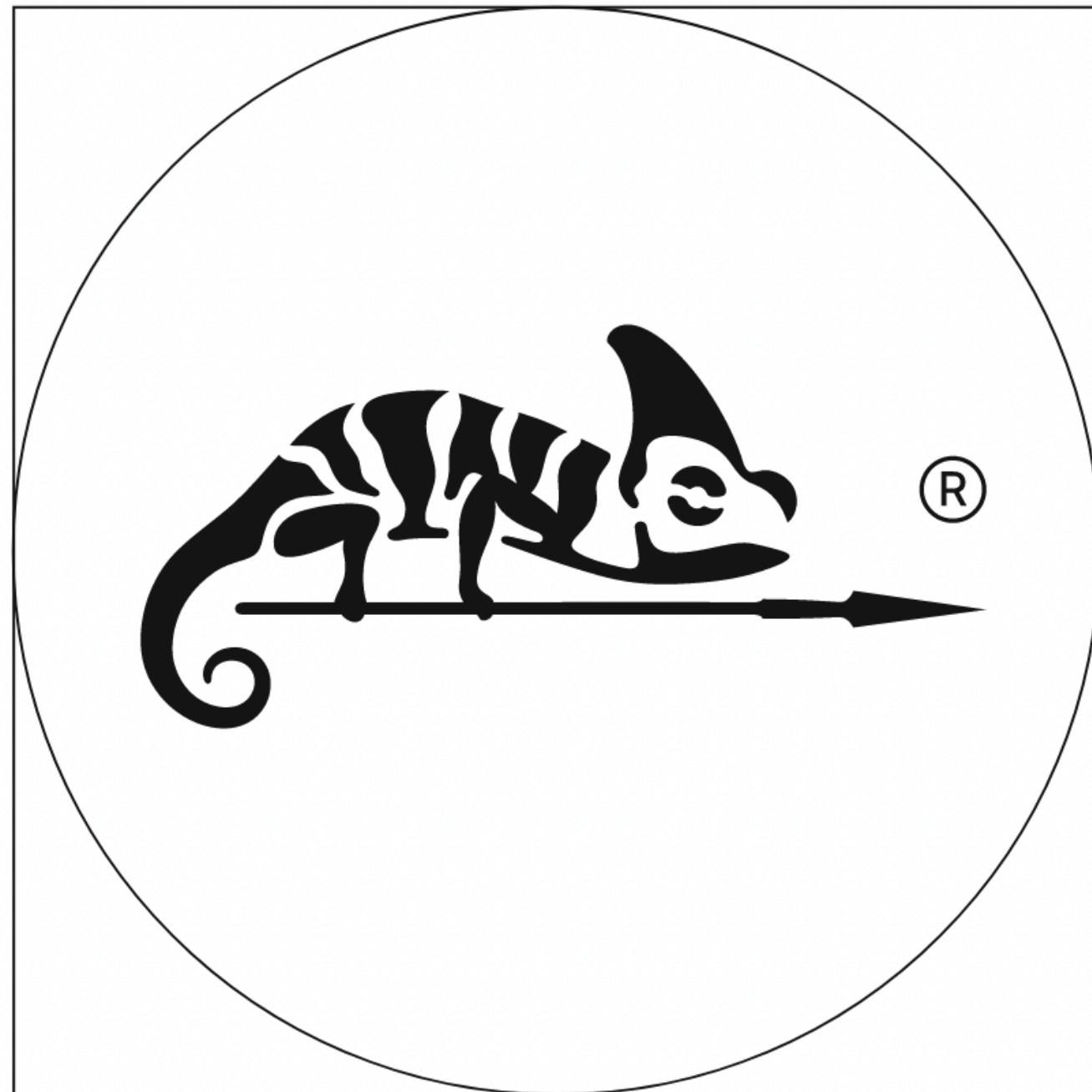
Pole ochronne sygnetu.

Pole ochronne to najmniejsza możliwa zamknięta przestrzeń otaczająca znak graficzny.